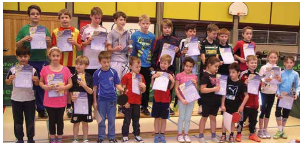
Siegerehrung mini-Meisterschaften 2016 in Anrath

In Anrath und Umgebung werden Mädchen und Jungen gesucht, die gerne einmal Tischtennis ausprobieren möchten, um dann vielleicht die erfolgreiche Jugendarbeit des Anrather Tischtennis-Klub Rot-Weiß 1947 e.V. (ATK) fortzusetzen. Hierzu bieten sich am Sonntag, 22. Januar 2017, die mini-Meisterschaften an. Ein Nachwuchsturnier für Mädchen und Jungen, die nach dem 31.12.2003 geboren sind und bisher noch nicht am offiziellen Spielbetrieb teilgenommen haben und weder Spielerpass noch Spielberechtigung besitzen. Deutschlandweit wird dieses Turnier vom Deutschen Tischtennis-Bund angeboten. Die Besten haben dabei die Chance, sich über weitere Qualifikationsturniere bis hin zum Deutschlandfinale durchzuspielen. Also auf zum ATK: